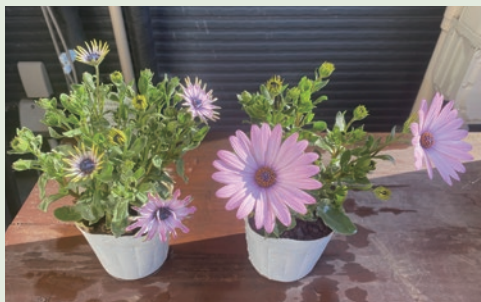
左: 未使用 右: 「体力BASE」「骨太BASE」使用