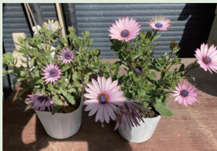
左: 未使用 右: 「体力BASE」「骨太BASE」使用