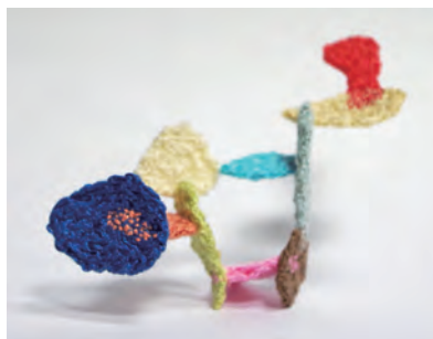
中村潤《糸系の法則 11》小