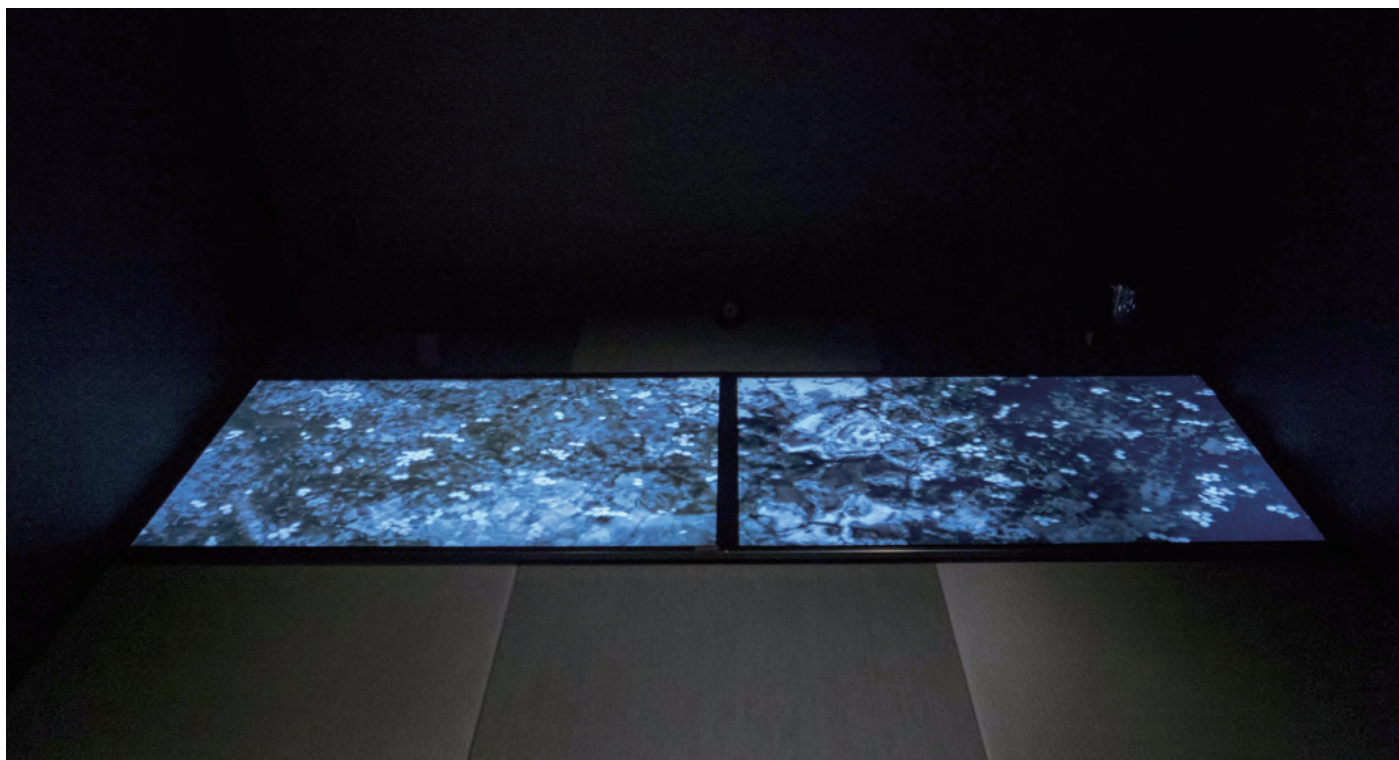
人長果月「Sakura」(インタラクティブ映像、会場:タイム堂和室)

京都府、ARTISTS' FAIR KYOTO実行委員会では、文化庁委託事業として地方の有望な若手作家の活躍の場を拡げる「ARTISTS' FAIR KYOTO : BLOWBALL」(アーティストズ フェア キョウト ブロウボール)を開催します。