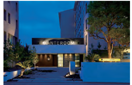
アンテルーム京都

参加方法は公式webを参照下さい。>>> https://artists-fair.kyoto/