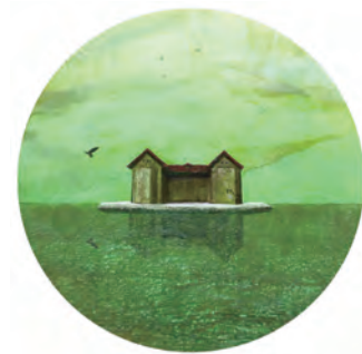
濱野裕理《Landscape of my mind》

京都府、ARTISTS' FAIR KYOTO 実行委員会 (事務局: 京都府文化スポーツ部文化芸術振興課)