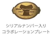
シリアルナンバー入り コラボレーションプレート