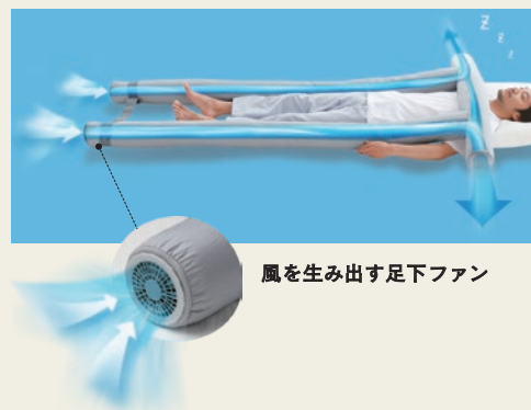
風を生み出す足下ファン

弾力性のある3Dエアファイバーやポリエステルわたなどで構成された3つの筒状の部位を組み合わせた、まるで鳥居のようなユニークな寝具は、かけ布団のように使ったり、しき布団のように使ったり、抱き枕のように使ったりと自由自在。どんな眠りのスタイルにもフィットして、雲の上にいるようなリラックスした眠りをお届けします。さらに足元には2つのファンを搭載。寝具の中を風が流れて熱と湿気を排出し、サラッと快適な寝心地を実現させています。冬は電源を入れず、かけ布団をかければ自由な寝心地はそのまま、中に空気層が生まれてあたたかく。一年中使える新スタイルの寝具の誕生です。