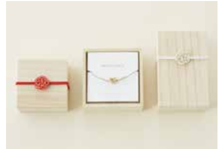
パッケージには桐箱と水引を使用。 大切な方への贈り物としてもオススメです。