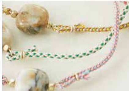
組紐はシルクを使用。 染めは京都の職人が丁寧に仕上げています。