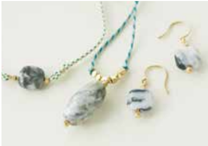
石は伊勢の五十鈴川上流で清め浄化した 全て1点ものの御心石。